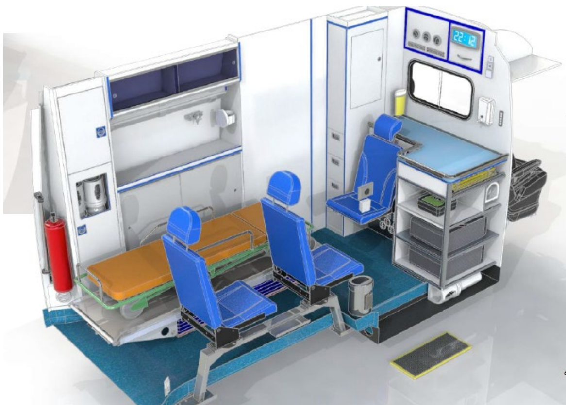
Conception option 6 du meuble frontal/d'angle et meuble paroi latérale