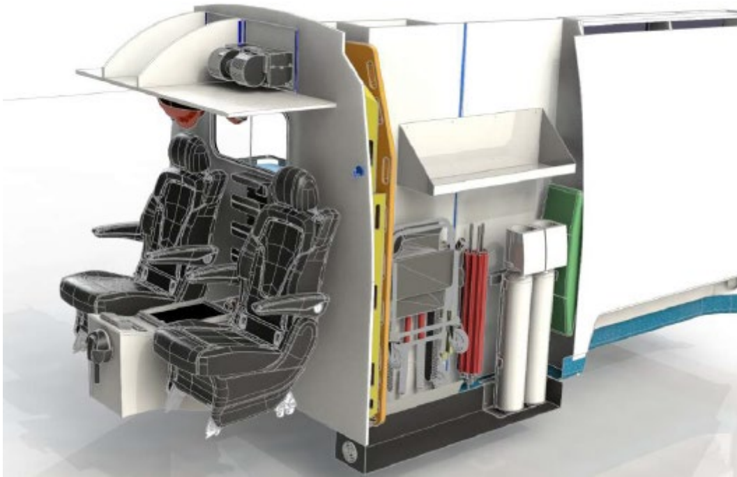
Conception de base