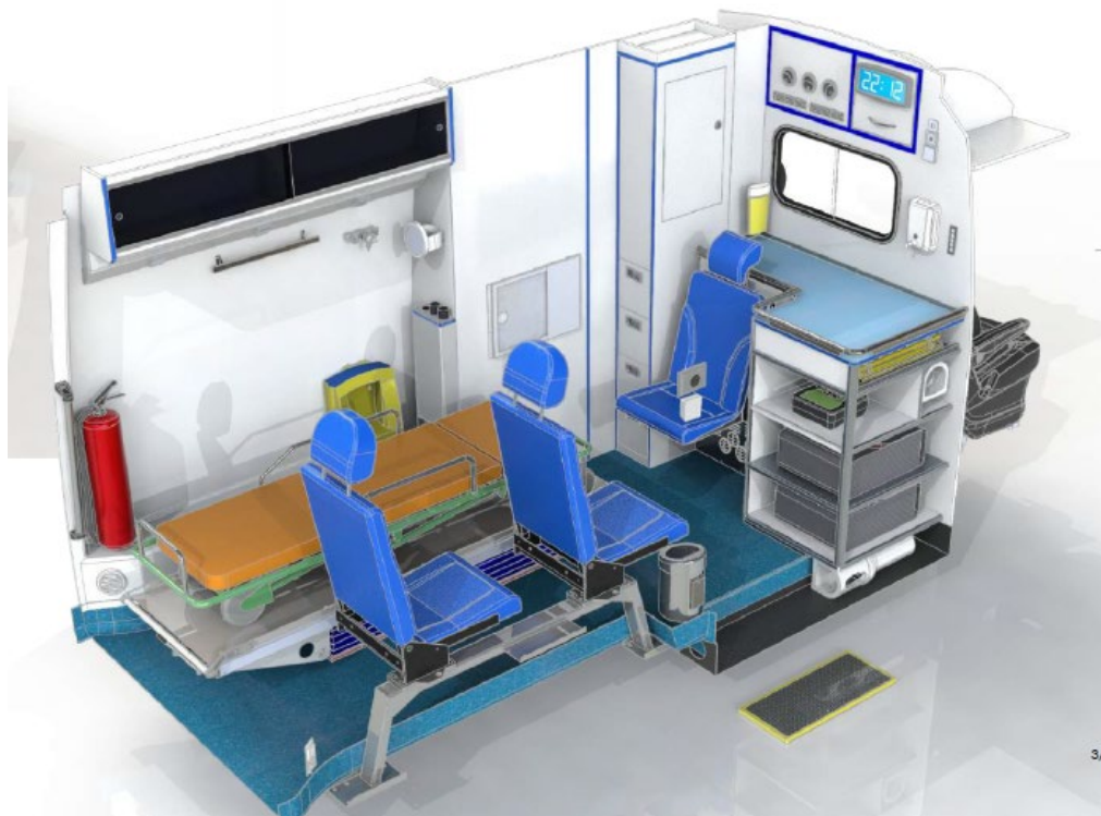
Conception de base du meuble frontal/d'angle et meuble paroi latérale

Meuble paroi latérale (côté conducteur): Il n'y a qu'une armoire d'angle d'environ 300(h)x250(l) mm avec portes coulissantes transparentes depuis le compartiment armoire derrière la porte coulissante, côté conducteur, jusqu'à la porte arrière au-dessus dans le coin contre le plafond. En dessous de cette armoire, il y a une gouttière à câbles à compartiments séparés pour des prises de courant 12V DC et 230V AC.