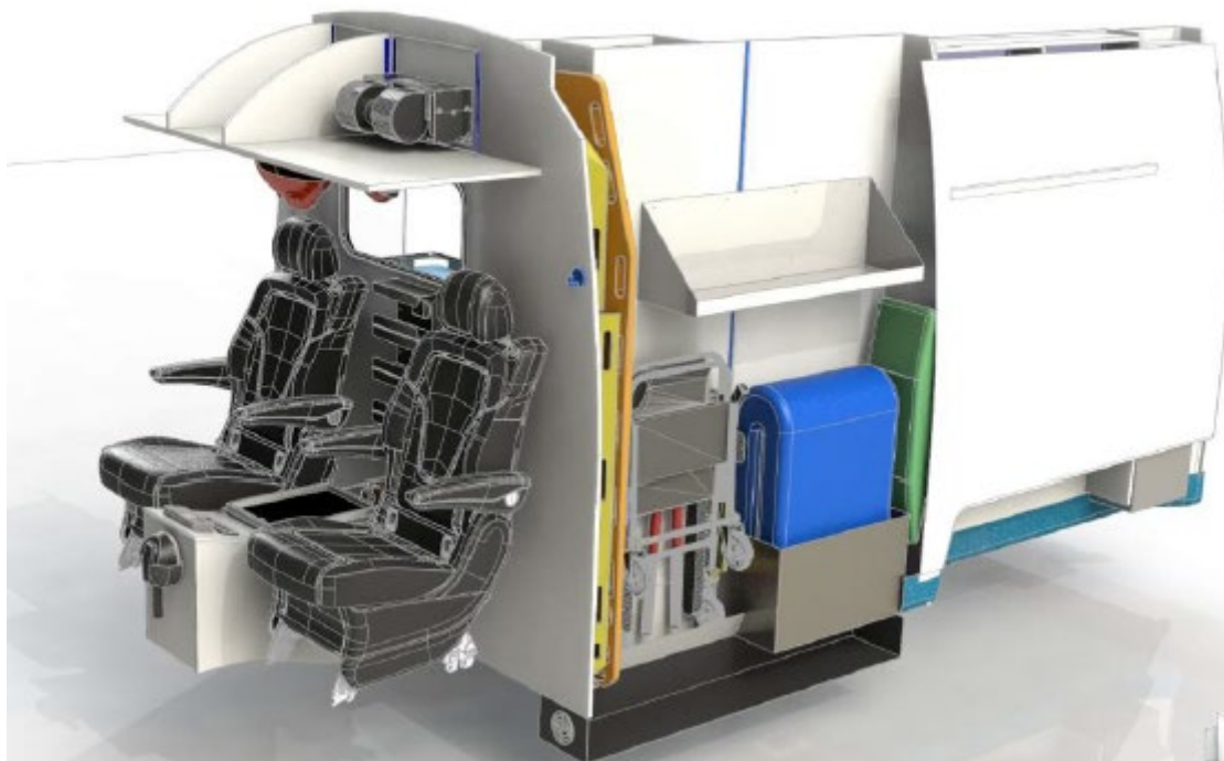
Conception option 6