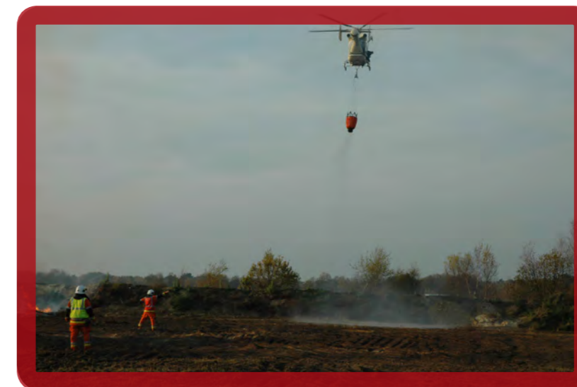
Een helikopter van de politie waaraan een reservoir met bluswater bevestigd is. Daarmee kan een brand vanuit de lucht bestreden worden, onder begeleiding van brandweerteams op de grond.

(Jérôme Glorie, directeur-generaal Civiele Veiligheid)