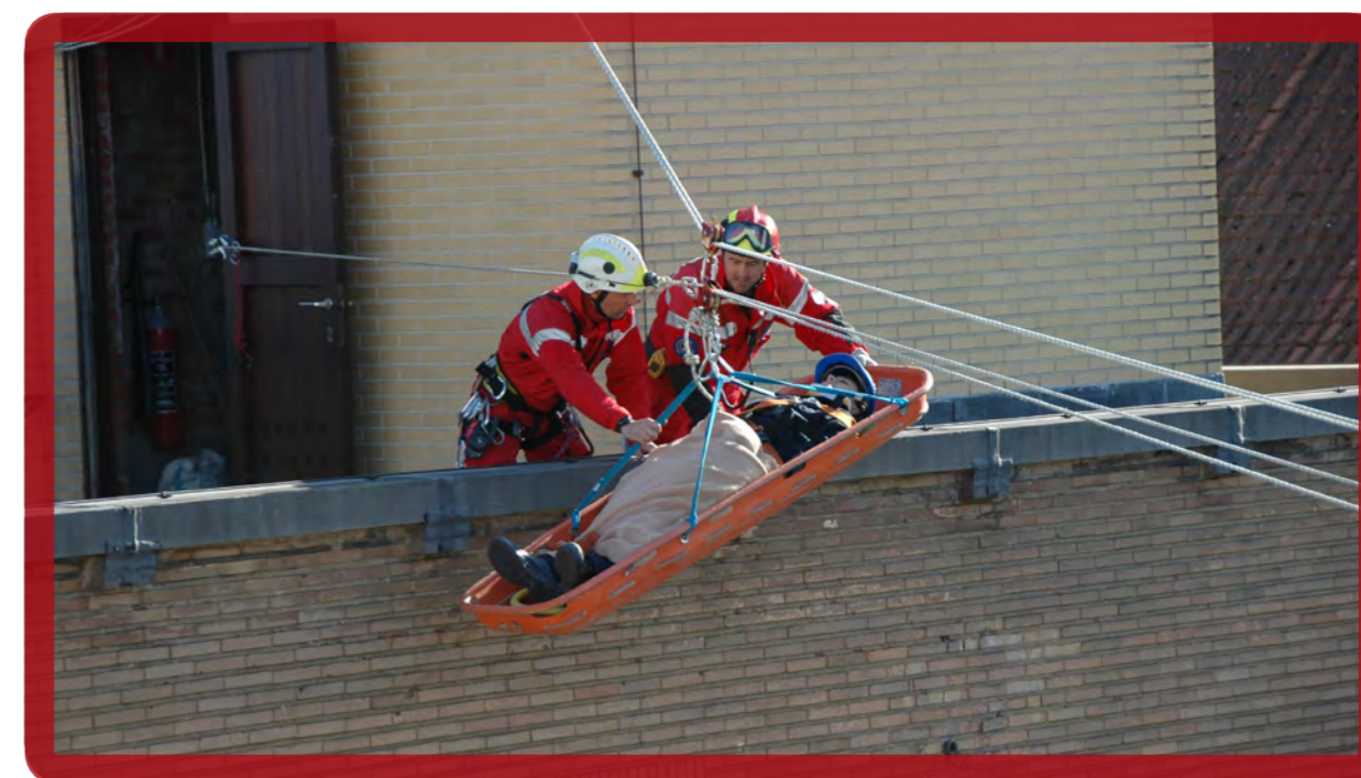
USAR-stagiairs tijdens een oefening om de slachtoffers van een aardbeving op te sporen en te redden.

De USAR-stagiairs zijn meermaals tussengekomen op verschillende plaatsen (verlaten industrieterreinen, onbewoonbaar verklaarde gebouwen ...) en hebben gespecialiseerd materieel gebruikt zoals telescopische camera's en een radio-uitrusting om slachtoffers onder het puin op te sporen. Ook hulpverleningsteams met honden en GRIMP-teams (Groep voor Redding en Interventie op Moeilijke Plaatsen) hebben deelgenomen aan de operaties. Voor het eerst hebben minidrones (kleine vliegtuigen zonder piloot) verkenningsvluchten gedaan boven de interventiezones.